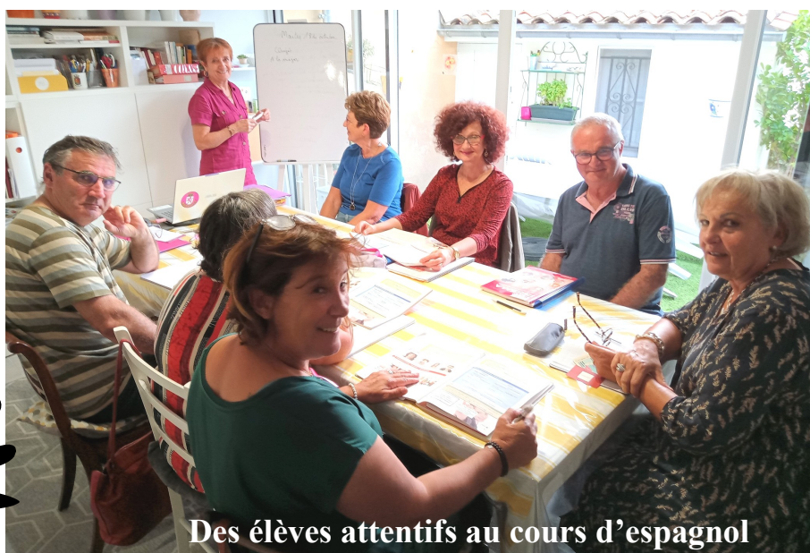
Des élèves attentifs au cours d'espagnol

Ce film, tourné dans le Pays basque avec ses paysages et ses villages raconte cette histoire unique qui laisse à réfléchir. Et comme a dit Maixabel: « Un jour ou l'autre, ces gens sortiront de prison, il vaut mieux qu'ils soient repentis ». L'ETA a officiellement cessé son activité en 2018 après un cessez-le feu en 2011.